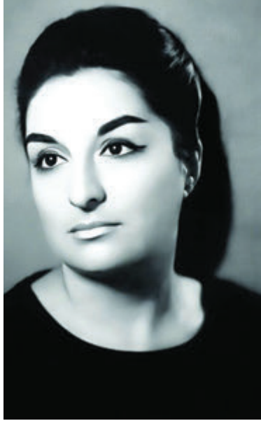
10 oktyabr görkəmli şərqşünas alim, Azərbaycan şərqşünaslığında ilk qadın elmlər doktoru, professor Aida İmanquliyevanın doğum günüdür.

Aida İmanquliyeva 1939-cu il oktyabrın 10-da Bakıda ziyalı ailəsində anadan olub. 1957-ci ildə Bakı şəhərindəki 132 nömrəli orta məktəbi qızıl medalla bitirib və Bakı Dövlət Universitetinin (BDU) Şərqşünaslıq fakültəsinin ərəb filologiyası bölməsinə qəbul olunub. 1962-ci ildə Universiteti bitirəndən sonra bu təhsil müəssisəsinin Yaxın Şərq xalqları ədəbiyyatı tarixi kafedrasının aspirantı olub, həmçinin keçmiş SSRİ EA Asiya Xalqları İnstitutunun aspiranturasında təhsil alıb. 1966-cı ildə namizədlik dissertasiyasını müdafiə edən Aida İmanquliyeva Azərbaycan Elmlər Akademiyasının Şərqşünaslıq İnstitutunda əmək fəaliyyətinə başlayıb. O, istedadı, zəhmətsevərliyi sayəsində kiçik elmi işçidən şöbə müdiri, elmi işlər üzrə direktor müavini və İnstitutun direktoru vəzifəsinədək yüksəlib.